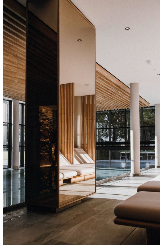
Bild 1 & 2: Wesentliches Charakteristikum des Mangfall-Spas ist das eindrucksvolle Spiel der Gegensätze und Elemente. Die lebendige Anmutung der senkrechten Holzlamellen gibt einen eindrucksvollen Kontrast zur ruhigen, kühlen Oberfläche des Pools ab, während die großen Fenster und Spiegelelemente für einen natürlichen Lichteinfall sorgen.