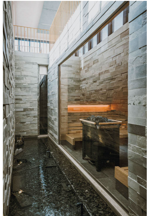
Bild 6 & 7: Die Finnische Sauna verwöhnt mit nordischer Ursprünglichkeit und begeistert sowohl mit ihrer klaren, großzügigen Ästhetik als auch einem authentisch heißen Saunagefühl.