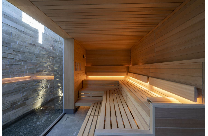
Bild 4: Das SANARIUM® ermöglicht nicht nur ein Saunavergnügen bei mildereren Temperaturen, sondern schafft durch die Transparenz der Glasfront und den Blick auf die Wand aus Naturstein zudem auch eine einzigartige Atmosphäre.